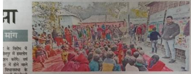
बच्चों के बीच जागरूकता बढ़ाने का अभियान

बसंतपुर के पुरेनी और भीमनगर के बाल पोषण की शुरुआत