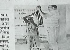
जरूरतमंद के बीच राहत किट बांटते कांसा के कार्यकर्ता

लोकभरती सेवा आश्रम, बसंतपुर के परिसर में कांसा संस्था की ओर से दीपोत्सव के अवसर पर जरूरतमंद परिवारों के बीच राहत किट प्रदान किया गया। वितरित किए गए पैकेट में चावल, गहू, आटा, दाल, चीनी, चना, सोयाबीन, नमक, तेल, साबुन, मसाला पाउडर, मार्क, सेबिटाइजर आदि दिया गया। इस राहत किट का वितरण बसंतपुर पंचायत के पुरेनी, हसमाननगर और रघुनाथपुर गांव के जरूरतमंद परिवारों को उपलब्ध कराया गया। राहत प्रदान करने के बाद लोकभरती