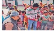
बच्चों में बच्चों का जागरूकता बढ़ाने का अभियान

बसंतपुर प्रखंड स्थित पुरेनी गांव में लोकभरती सेवा आश्रम की ओर से कराया गया सर्वे अभियान का 6 घंटे से 5 घंटे तक के बच्चों का सर्वेक्षण कार्य किया। यह सर्वेक्षण बच्चों में कुपोषण को दूर करने, शिक्षा के प्रति बच्चों की जागरूकता बढ़ाने और बच्चों की हरी हरी तस्कारी को रोकने के लिए एक अभियान था।