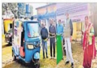
जागरूकता रथ को रवाना करते संस्था के सदस्य

लोकभरती सेवा आश्रम की ओर से कराया गया सर्वे अभियान का 6 घंटे से 5 घंटे तक के बच्चों का सर्वेक्षण कार्य किया। यह सर्वेक्षण बच्चों में कुपोषण को दूर करने, शिक्षा के प्रति बच्चों की जागरूकता बढ़ाने और बच्चों की हरी हरी तस्कारी को रोकने के लिए एक अभियान था।