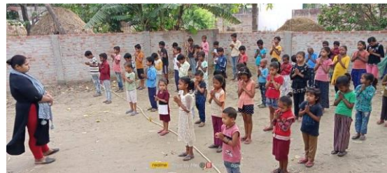
shine star international school

For quality education, Lok Bharti Seva Ashram is running a school for poor, underprivileged children in its head office campus, in which around 100 children are directly benefiting from the school equipped with all the latest facilities.